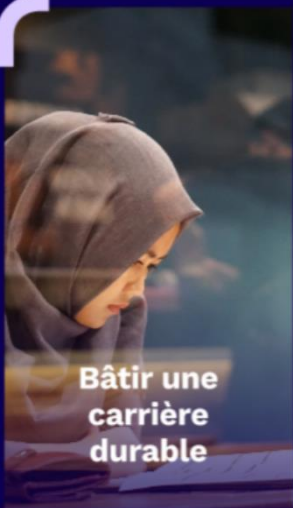
Bâtir une carrière durable