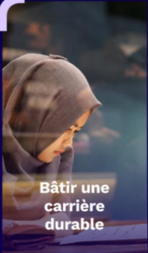
Bâtir une carrière durable