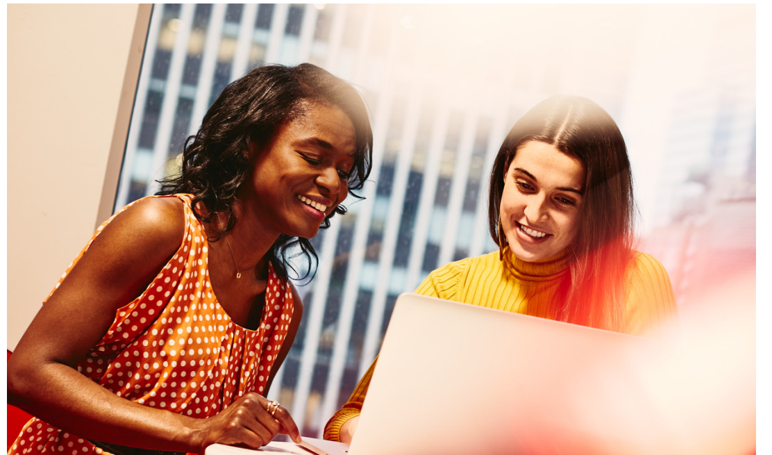
Toutes les six semaines, un moment de "great conversation" est planifié. C'est l'occasion pour l'employé et le manager de communiquer très ouvertement. Il est principalement destiné à regarder votre évolution personnelle et vers où vous voulez aller. ▶ D.R.