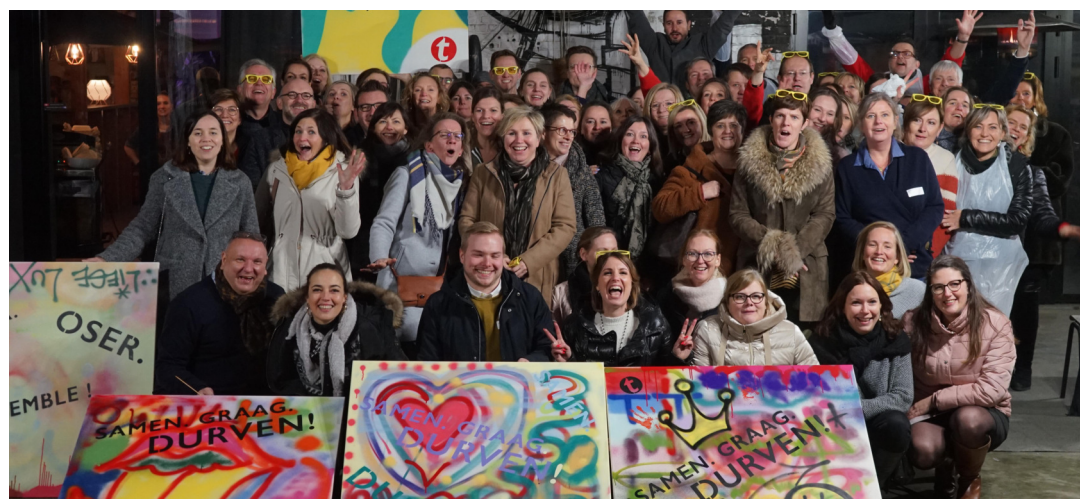
Autour des valeurs " Aimer. Oser. Ensemble ! ", les 400 collaborateurs de Tempo-Team à travers 100 agences, proposent du travail (plus de 3.300 emplois) dans un grand nombre de secteurs et de fonctions.

L'organisation a renouvelé sa stratégie en matière de gestion des talents, en misant sur la "learning agility" parce que les jobs d'aujourd'hui sont plus mouvants et polyvalents que jamais.