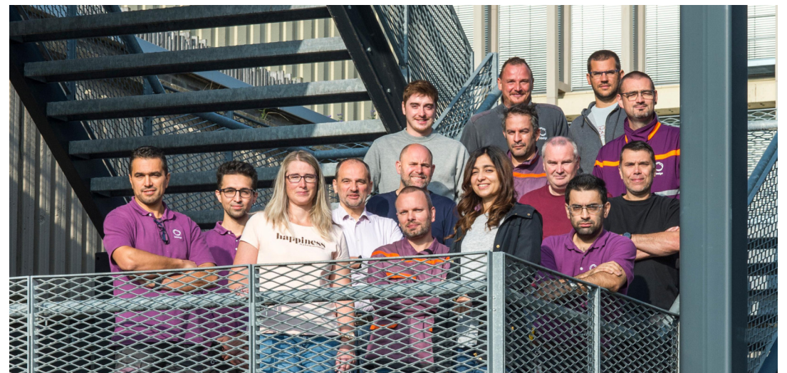
Les défis auxquels Sibelga et ses 1 050 collaborateurs sont confrontés sont principalement liés à l'informatique et à la numérisation. Les ingénieurs et techniciens ont également de nombreux défis à relever.