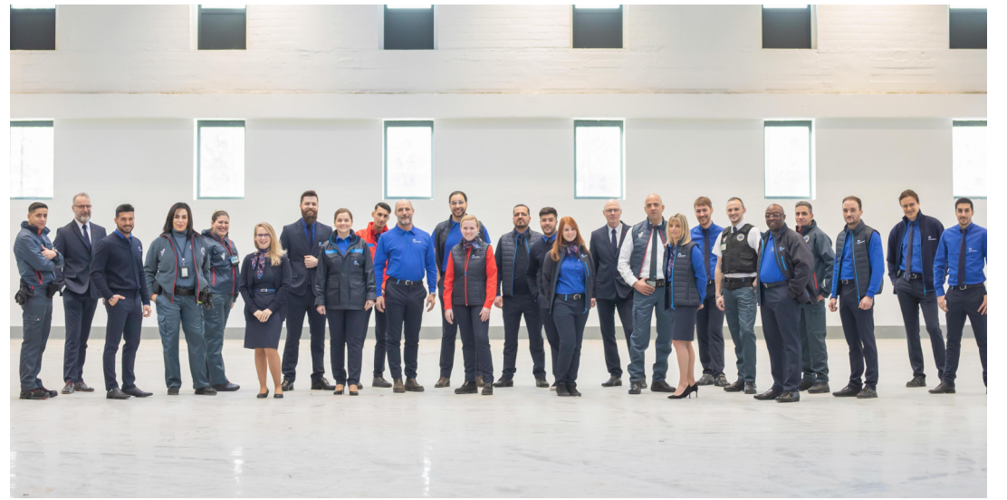
Nous misons sur la diversité des postes et des personnes, et ça, pas juste pour faire joli. Nous sommes le reflet de Bruxelles et nous voulons à la fois que le travailleur et le client se retrouvent dans notre entreprise. ▶ (Photo prise hors période de restrictions Covid.)