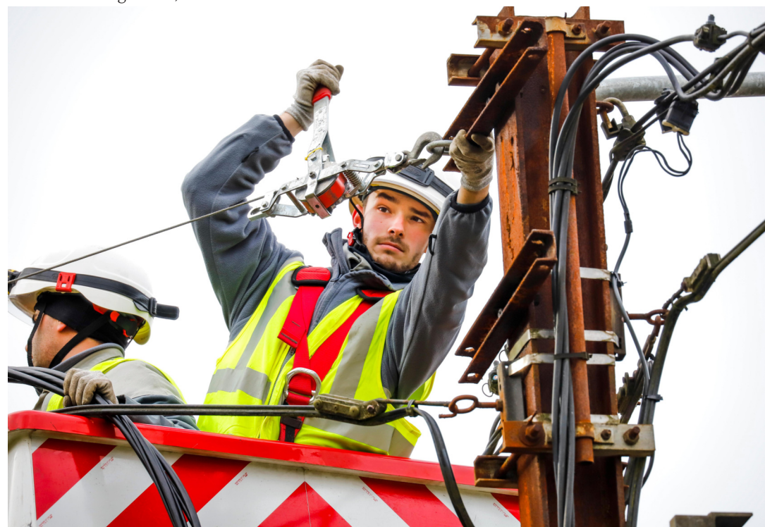
Principal gestionnaire de réseaux de distribution d'électricité et de gaz naturel en Wallonie, ORES s'est vu décerner, pour la première fois, le titre de Top Employer qui récompense les entreprises engagées dans une politique RH axée sur les talents.