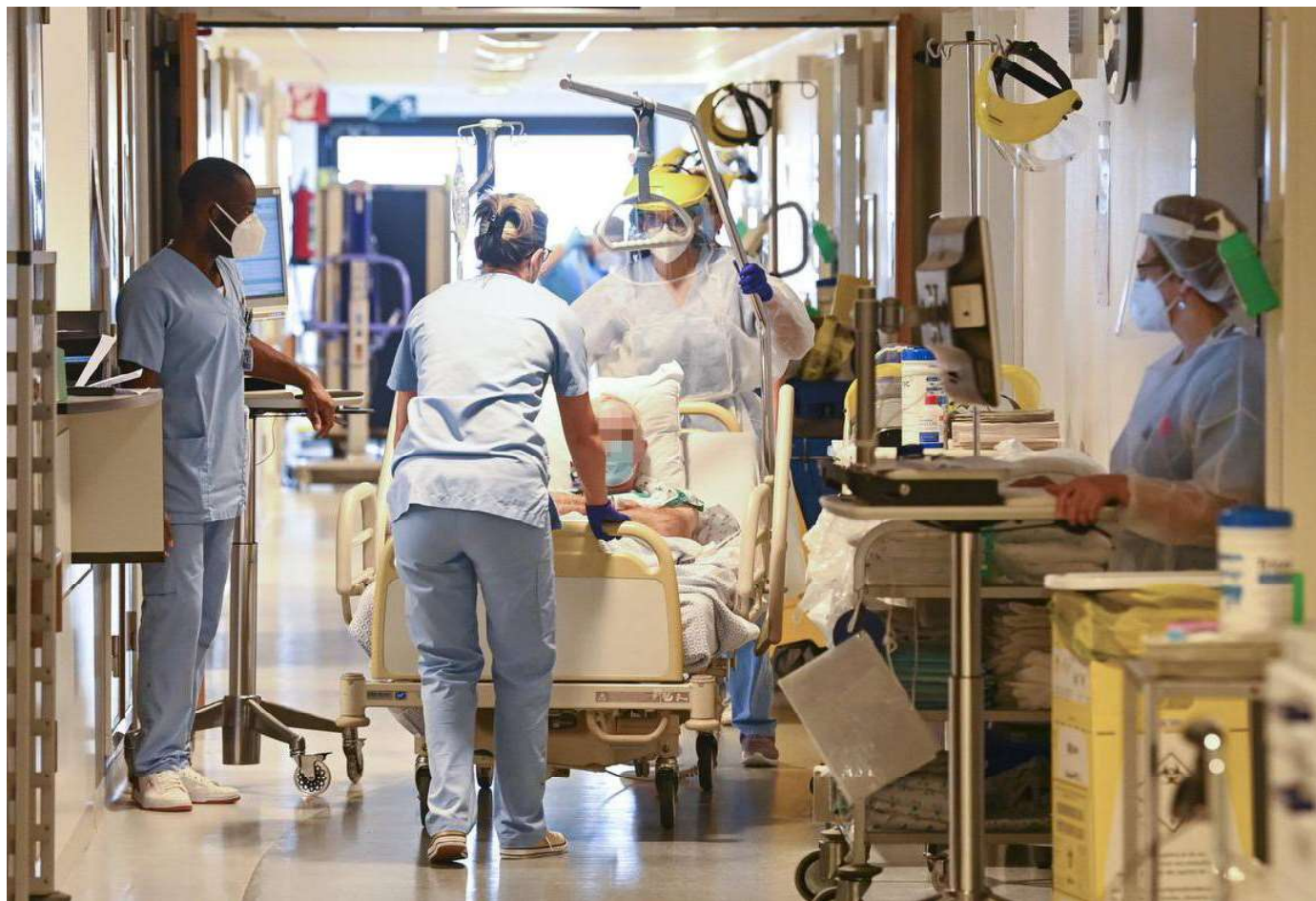
« La pénurie existe déjà depuis plusieurs années, mais l'élément déclencheur correspond au passage des études en quatre ans, en 2019. »

Infirmiers, infirmières : il manque de bras dans le secteur des soins de santé. Pour pallier la pénurie, l'hôpital Saint-Luc, à Bruxelles, apporte sa réponse.