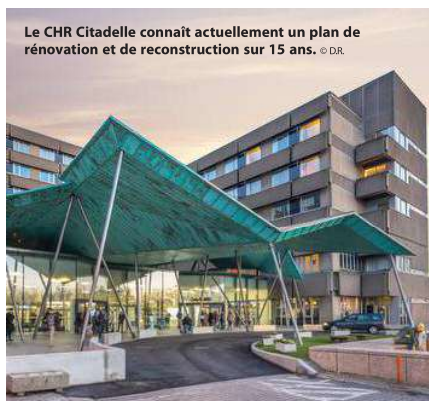
Le CHR Citadelle connaît actuellement un plan de rénovation et de reconstruction sur 15 ans.