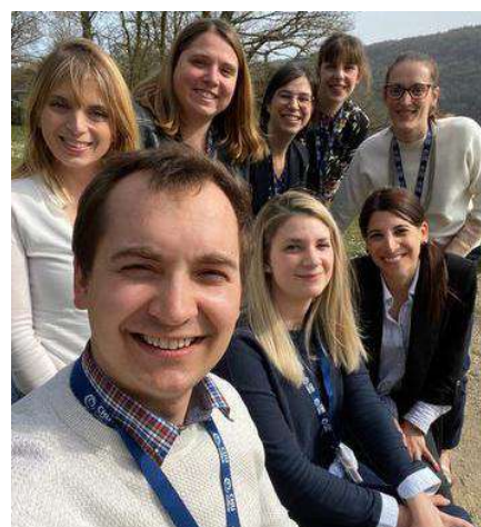
À travers le projet RISH (Recrutement Infirmier Soignant Hospitalier), l'objectif de l'équipe recrutement et sélection du CHU UCL Namur est véritablement de mettre l'expérience candidat au centre tout en garantissant la qualité des soins prodigués aux patients en recrutant les meilleur(e)s infirmier(s)/infirmières.

Attirer de nouveaux infirmiers dans le contexte actuel n'est pas chose aisée, pour elle et ses deux collègues. « Les études ont été prolongées et je pense que, vis-à-vis des candidats, il faut être dans un état d'esprit positif et leur faire comprendre « Vous comptez déjà pour nous ». Notre réactivité est aussi un atout, tout comme le fait d'être un hôpital universitaire. Il y a donc derrière tout un réseau, avec de la technologie et des développements intéressants.