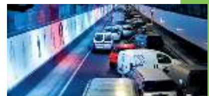
Exercice incendie dans le Tunnel Annie Cordie, Bruxelles | Nuit du 17 au 18/05/2022