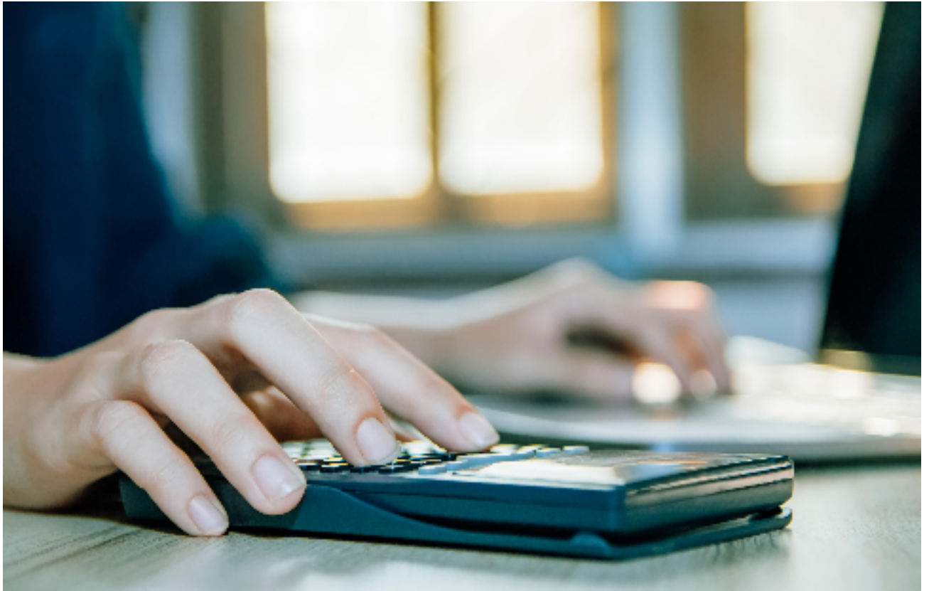
Le versement éventuel de la prime, d'un montant maximal de 500 ou 750 euros, est dépendant des résultats financiers de l'entreprise.

Mais force est de constater, selon un sondage mené par SD Worx, que l'idée ne séduit pas vraiment chez les employeurs, en particulier dans les PME auxquelles le prestataire de services RH s'est intéressé (731 patrons interrogés, les entreprises employant de 1 à 250 travailleurs). Seule une PME sur dix (9,2 %) prévoit en effet d'accorder à ses travailleurs cette nouvelle prime unique pour le pouvoir d'achat, la majorité