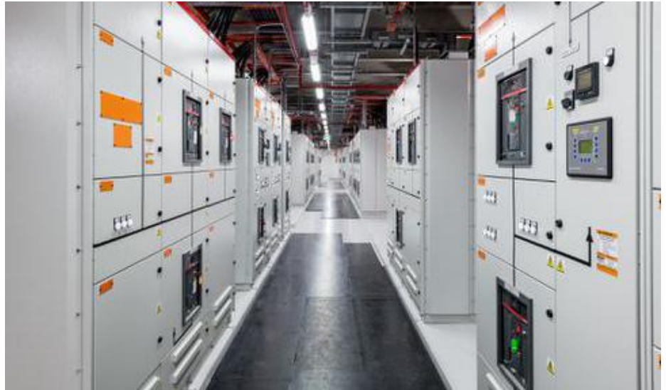
Ces panneaux de distribution électrique sont l'un des nombreux éléments constitutifs de notre centre de données.

d'apprendre et leur débrouillardise. Certes le département est stable, bien établi et bien documenté. Toutefois, il leur faut avoir la capacité de suivre les innovations, qui se font souvent en interne. Nous sommes toujours sur la 'pointe tranchante du couteau' en termes de technologie, avec des éléments non encore répandus dans l'industrie. Cet environnement de production n'est donc pas simple. »